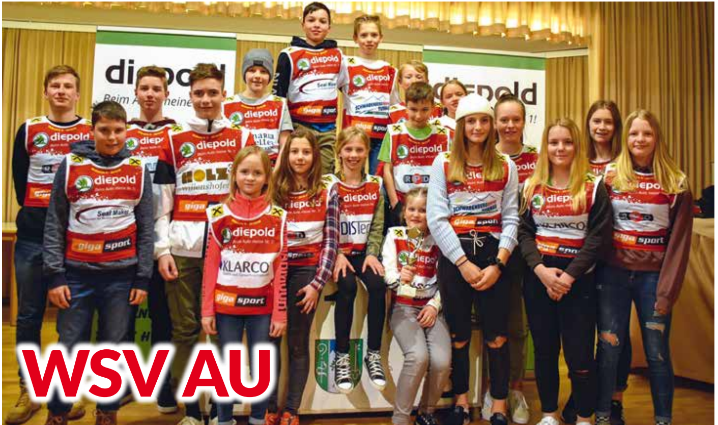
Gesamtsiegerehrung des Ski-Bezirks 5

A ls Obmann des Wintersportvereins Au kann ich auf ein erfolgreiches Jahr zurückblicken und danke allen Funktionärinnen, Vereinsmitgliedern und MitarbeiterInnen für die hervorragende Arbeit und ihren Einsatz im heurigen Jahr. Besonderer Dank gebührt auch den Sponsoren und den Förderern des Vereins.